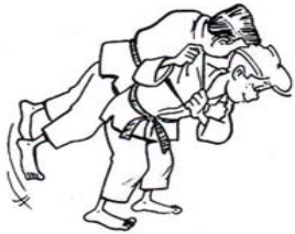
IPPON-SEOI-NAGE PROJECTION PAR UNE ÉPAULE