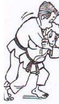
MOROTE-SEOI-NAGE "avec barrage"

projection par-dessus le dos a deux mains barrage avec la jambe