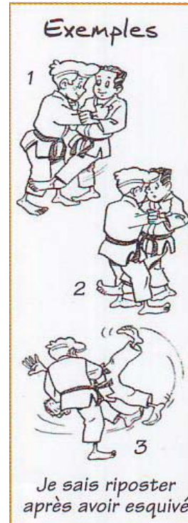
Situation D'études Debout