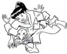
KUZURE-GESA-GATAME VARIANTE DE CONTRÔLE PAR LE TRAVERS

Osaekomi-Waza (Immobilisation) ( Variante )