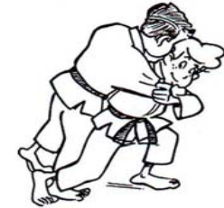
TAI-OTOSHI RENVERSEMENT DU CORPS AVEC BARRAGE