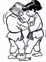
KO SOTO-GARI PETIT FAUCHAGE EXTÉRIEUR