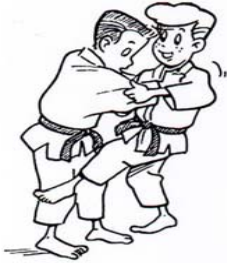
HIZA-GURUMA ROUE AUTOUR DU GENOU