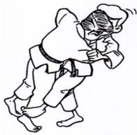
SASAE-TSURIKOMI-ASHI BLOCAGE DU PIED EN PÉCHANT