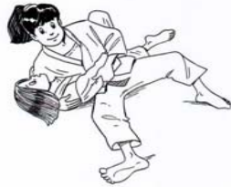
HON-GESA-GATAME CONTRÔLE LATÉRO-COSTAL