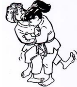
O SOTO-GARI GRAND FAUCHAGE EXTÉRIEUR